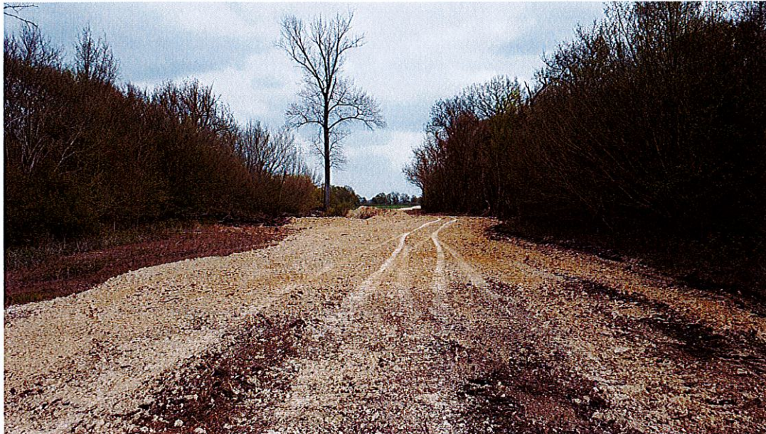
Dans le dos : la Seine, à gauche l'état naturel avec les traces de crue, au centre le remblai pour le tapis